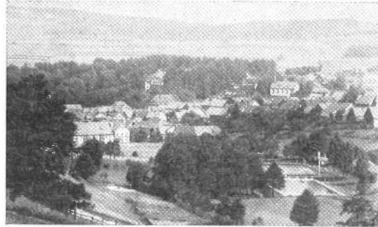
Blick auf die Wettkampf-Anlagen in Gersfeld