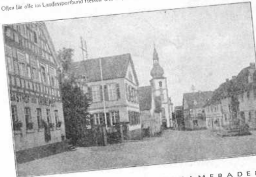
Marktplatz in Gersfeld

Offiziell für alle im Landesverband Hessen und Bayern zusammengeschlossenen Turn- und Sportvereine